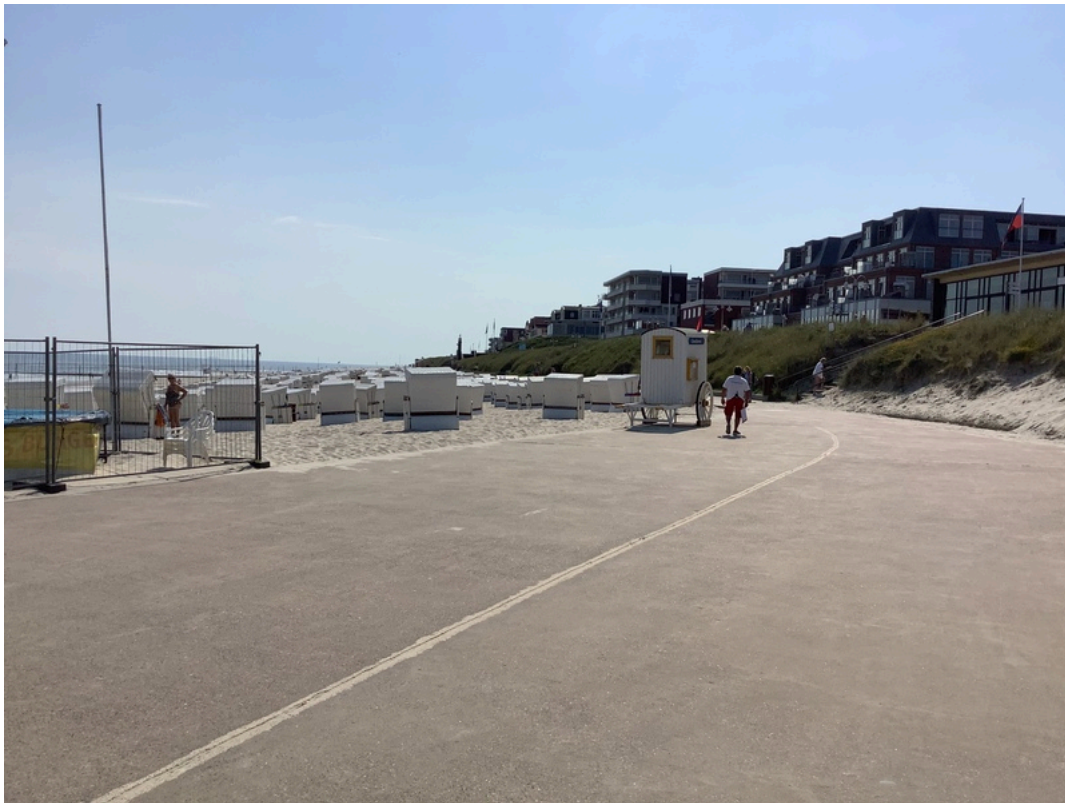
Bade- und Burgenstrand Westfeld