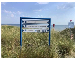
Bedienelemente / Leitsystem