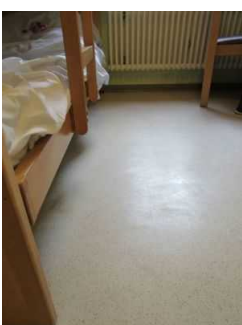
Bewegungsfläche im Zimmer