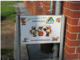
Beschilderung Jugendherberge Mardorf