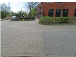
Weg zum Eingang