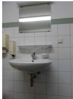
Waschbecken mit Spiegel