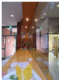
Eingangsbereich Jugendherberge Mardorf

Name und Logo des Betriebes/der Einrichtung sind von außen klar erkennbar.