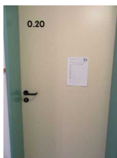
Tür zum Schlafrum