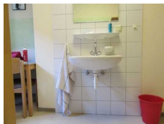
Waschbecken im Schlafrum