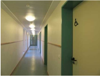
Flur zum Schlafraum