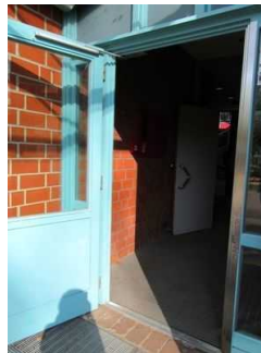
Eingang Jugendherberge Mardorf