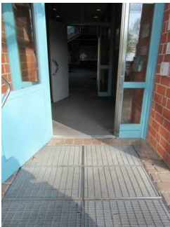
Eingangsbereich Jugendherberge Mardorf