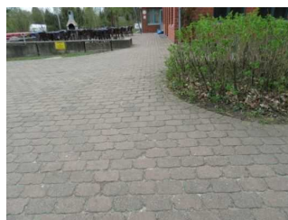
Außenweg vom P zum Eingang